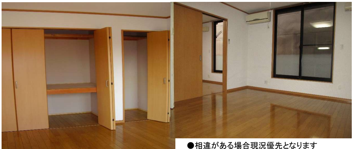
●相違がある場合現況優先となります